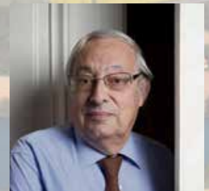
Bertrand Badie Professeur émérite des Universités à l'IEP de Paris